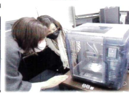
3Dプリンターによる立体確認